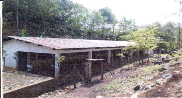
Foto1: cambio de cubierta de lamina modulo 1